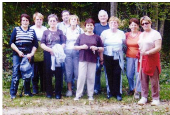
Le groupe de marche.