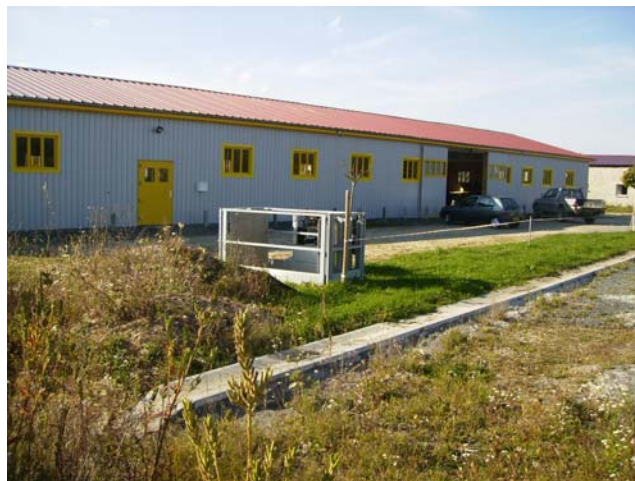
Devant ce bâtiment se dresseront les bureaux

En 2007, j'ai acheté un terrain de 2300 m 2 viabilisé à la communauté de communes Livradois Porte d'Auvergne. J'ai commencé la construction, le 20 décembre 2007 avec mon entreprise, d'un premier bâtiment à ossature bois, d'une surface de 500 m 2 , destiné à l'atelier. Celui-ci, qui est visible de la route, est maintenant terminé. Je souhaitais le barder en bois, mais la DDE m'a fortement préconisé le bardage en galva. Nous allons, devant celui-ci, construire les bureaux de l'entreprise. Derrière ce premier bâtiment je vais en construire un deuxième destiné au stockage